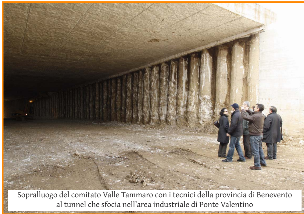
Sopralluogo del comitato Valle Tammaro con i tecnici della provincia di Benevento al tunnel che sfocia nell'area industriale di Ponte Valentino

Ciò non sarebbe male, se non fosse che l'intera somma di € 3.921.076,6 è da utilizzarsi integralmente e improrogabilmente, da Accordo di Programma Quadro, nel tratto tra Benevento e Paduli. Tutto ciò in quanto, tale tratto, in seguito alla divisione della strada in due lotti funzionali (Benevento - Paduli, circa 4 km; Paduli - S. Giorgio la Molarola, circa 11 km), rappresenta il lotto n°1, il quale, con la sola aggiunta del risanamento della frana