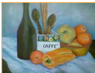
Natura morta Acrilico su tela

Quanti fedeli nella chiesa di San Luca, per la novena dell'Immacolata, e noi ragazzi nella piazzetta antistante giocavamo al più non posso. Di tanto in tanto il sacrestano munito di bastone, ci correva die-